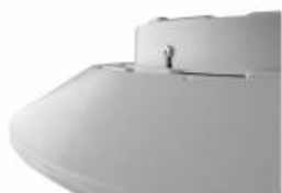
CAPELLA LED BOX ANTYWANDAL