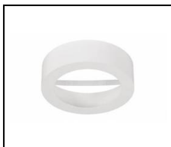
RUNDES GEHÄUSE FRAGA 6W / 11W. NECTRA 5W / 7W / 7W IP44 (059841)