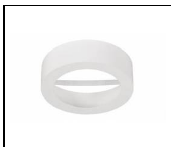
RUNDES GEHÄUSE FRAGA 15W. NECTRA 9W / 9W IP44 (059858)