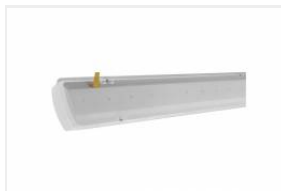
TYTAN LED HALL 1450mm 9200lm 830 - moduł świetlny (907739)