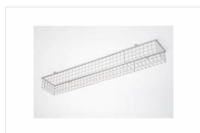
TYTAN LED, ATLAS LED - siatka ochronna 1432mm (907920)