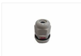
Dławnica odpowietrzająca szara M20*1.5 IP68 (16000507)