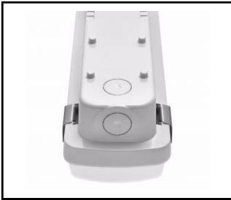
wybór miejsca zasilania / choosing a place of power supply / Stromversorgungsanschluss von mehreren Seite möglich