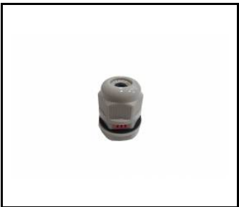
Divers presse-étoupe gris M20 * 1.5 IP68 (16000507)