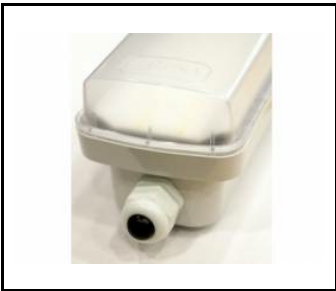
Bouchon presse-étoupe M16. divers PA noir M-16 - BPM-21 (60000006)