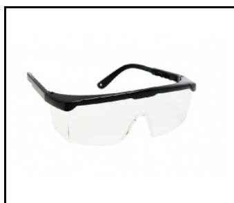
Lunettes de protection UV-C (243639)

Date de création de la carte: 03 janvier 2025