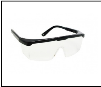
Schutzbrille UV-C (243639)

Erstellungsdatum der Karte: 03 Januar 2025