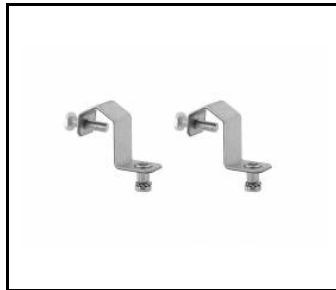
Industry IP23 - Leinenhaken (543944)