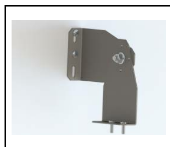
TYTAN LED, ATLAS LED, INDUSTRY LED - UCHWYT REGULOWANY KOMPLET (2szt.) (908200)