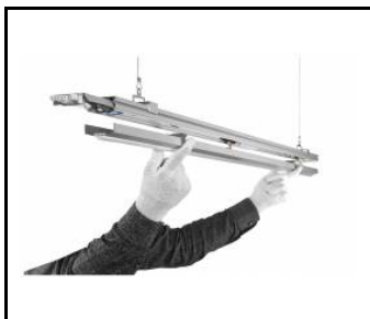
LINEA 3 LED