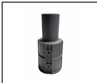
Adaptateur pour poteau 80/60 ALU (598357)