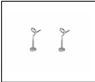
INDUSTRY LED accrochée à une chaîne (541247)