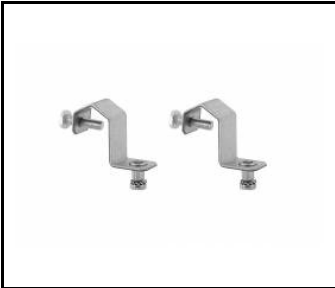
Industry IP23 - Leinenhaken (543944)