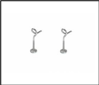
INDUSTRY LED Kettenaufhänger (541247)