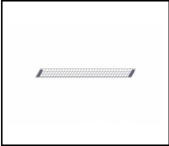
INDUSTRY LED Schutzgitter 1490mm x3 (zur Version 153W) (539992)

Erstellungsdatum der Karte: 16 Dezember 2025 Der Hersteller behält sich das Recht vor, Produktverbesserungen und Designänderungen oder Modernisierung in den Produkten vorzunehmen. * Parametertoleranz beträgt +/- 10 %Das Produktdatenblatt ist kein kommerzielles Angebot.