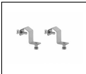
INDUSTRY LED hak do zwieszania na lince (kpl. 2 szt.) (543944)