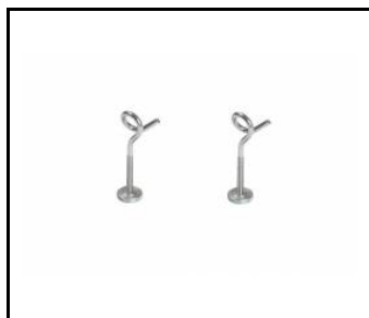
INDUSTRY LED zawieszanie do łańcuszka (kpl. 2 szt.) (541247)