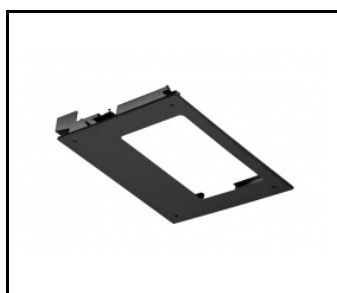
QUEST 2 LED L - cadre en saillie (699986)