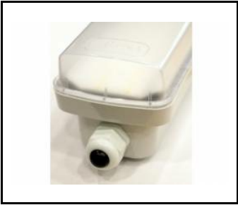
Blindstopfen für M16-Kabelverschraubung verschiedene PA schwarz M-16 – BPM-21 (60000006)

Erstellungsdatum der Karte: 08 Januar 2025