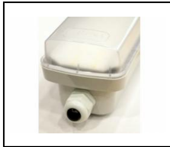
Blindstopfen für M16-Kabelverschraubung verschiedene PA schwarz M-16 – BPM-21 (60000006)

Erstellungsdatum der Karte: 08 Januar 2025