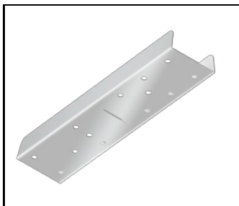
Baris 52 - connecteur linéaire. droit (318023)

Date de création de la carte: 03 janvier 2025