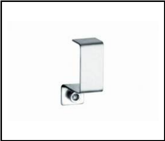
Support de montage pour la lampe TYPE 101 (899140)

Date de création de la carte: 09 novembre 2023