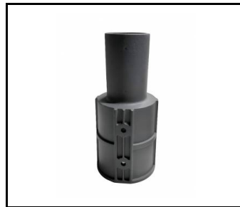
Adaptateur pour poteau 80/60 ALU (598357)