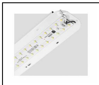
TYTAN 2 LED HALL 1450mm 10400lm 840 90D - module d'éclairage (367243)

Date de création de la carte: 08 janvier 2025