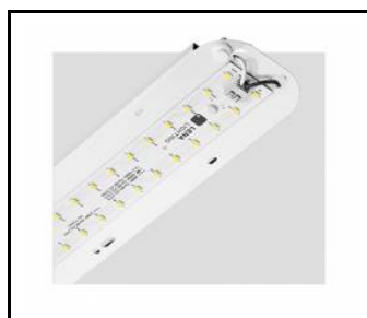
TYTAN 2 LED HALL 1150mm 8250lm 840 70D - module d'éclairage (367113)