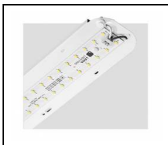
TYTAN 2 LED HALL 1450mm 10300lm 840 70D - module d'éclairage (367236)