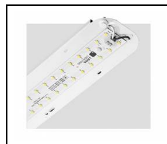
TYTAN 2 LED HALL 1150mm 8350lm 840 90D - module d'éclairage (367120)