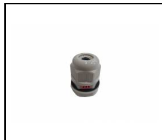
Divers presse-étoupe gris M20 * 1.5 IP68 (16000507)