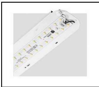
TYTAN 2 LED HALL 1450mm 10200lm 840 60D - module d'éclairage (367229)