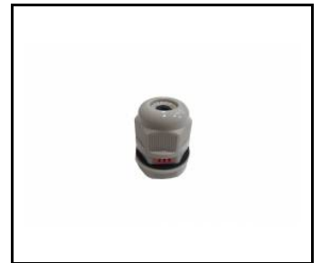
Divers presse-étoupe gris M20 * 1.5 IP68 (16000507)