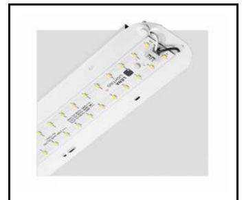
TYTAN 2 LED HALL 1150mm 8350lm 840 90D - module d'éclairage (367120)