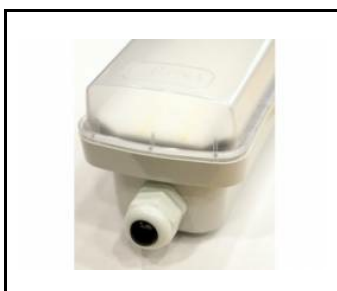
Bouchon presse-étoupe M16, divers PA noir M-16 - BPM-21 (60000006)