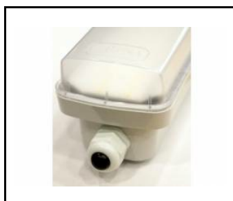
Bouchon presse-étoupe M16, divers PA noir M-16 - BPM-21 (60000006)