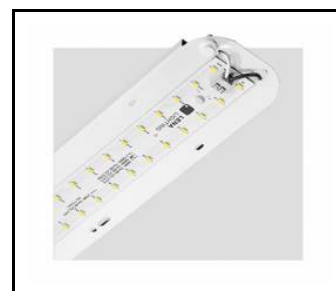
TYTAN 2 LED HALL 1150mm 8350lm 840 90D - module d'éclairage (367120)