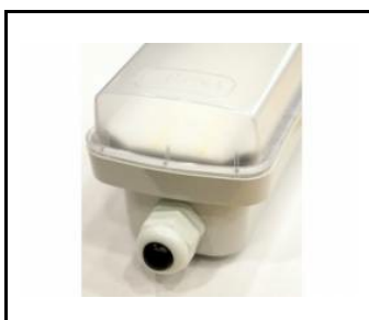
Bouchon presse-étoupe M16. divers PA noir M-16 - BPM-21 (60000006)