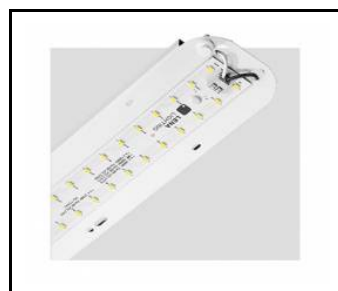
TYTAN 2 LED HALL 1150mm 8350lm 840 90D - module d'éclairage (367120)