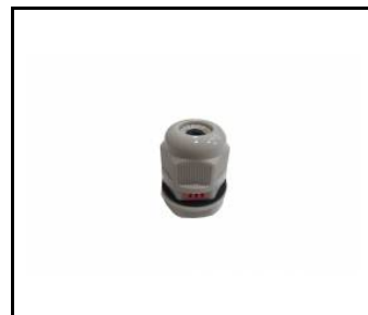
Divers presse-étoupe gris M20 * 1.5 IP68 (16000507)