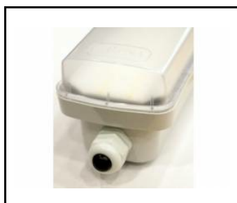
Bouchon presse-étoupe M16, divers PA noir M-16 - BPM-21 (60000006)