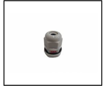
Drüse Entlüftung verschiedene grau M20*1.5 IP68 (16000507)