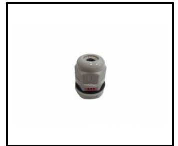
Drüse Entlüftung verschiedene grau M20*1.5 IP68 (16000507)