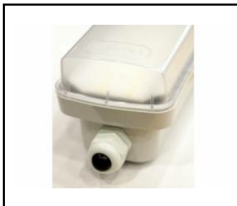
Blindstopfen für M16-Kabelverschraubung verschiedene PA schwarz M-16 - BPM-21 (60000006)