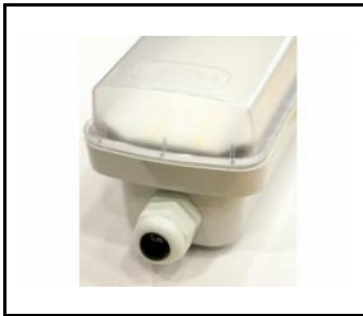
Blindstopfen für M16-Kabelverschraubung verschiedene PA schwarz M-16 - BPM-21 (60000006)