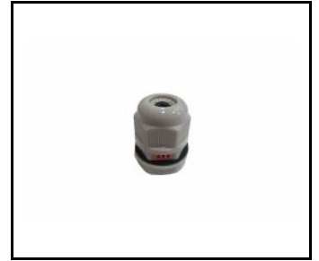
Drüse Entlüftung verschiedene grau M20*1.5 IP68 (16000507)