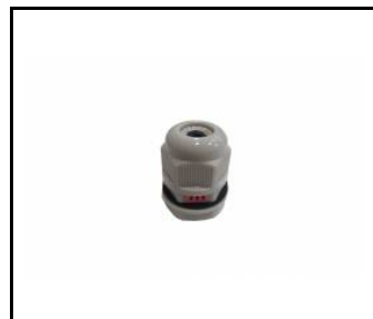
Drüse Entlüftung verschiedene grau M20*1.5 IP68 (16000507)