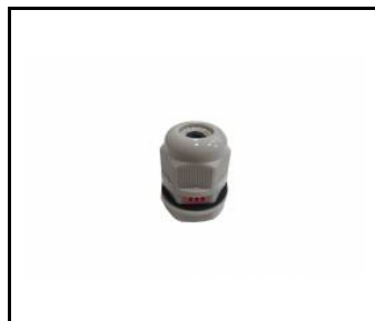
Drüse Entlüftung verschiedene grau M20*1.5 IP68 (16000507)