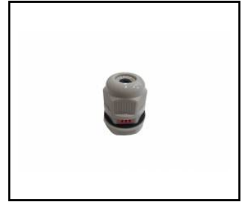
Dławnica odpowietrzająca różne szara M20*1.5 IP68 (16000507)