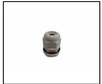
Dławnica odpowietrzająca różne szara M20*1.5 IP68 (16000507)