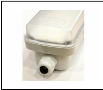
Zaślepka dławnicy M16 różne PA czarna M-16 - BPM-21 (60000006)