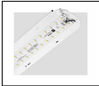
TYTAN 2 LED HALL 1450mm 10300lm 840 70D - moduł świetlny (367236)