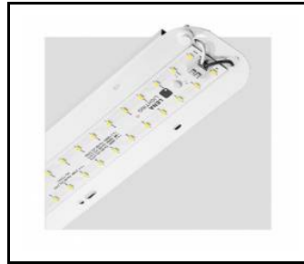
TYTAN 2 LED HALL 1150mm 8250lm 840 70D - moduł świetlny (367113)