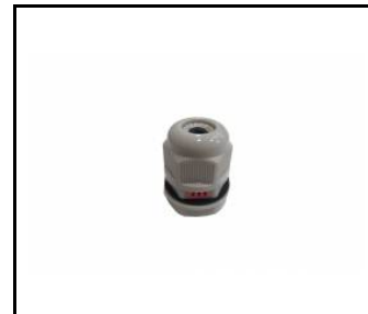
Dławnica odpowietrzająca różne szara M20*1.5 IP68 (16000507)