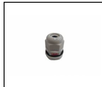
Dławnica odpowietrzająca różne szara M20*1.5 IP68 (16000507)