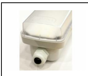
Zaślepka dławnicy M16 różne PA czarna M-16 - BPM-21 (60000006)