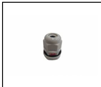
Dławnica odpowietrzająca różne szara M20*1.5 IP68 (16000507)