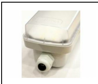
Zaślepka dławnicy M16 różne PA czarna M-16 - BPM-21 (60000006)