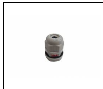
Dławnica odpowietrzająca różne szara M20*1.5 IP68 (16000507)