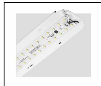
TYTAN 2 LED HALL 1150mm 8350lm 840 90D - moduł świetlny (367120)