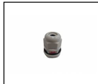
Dławnica odpowietrzająca różne szara M20*1.5 IP68 (16000507)