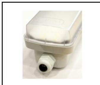
Zaślepka dławnicy M16 różne PA czarna M-16 - BPM-21 (60000006)