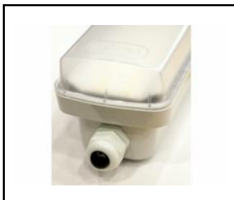
Zaślepka dławnicy M16 różne PA czarna M-16 - BPM-21 (60000006)