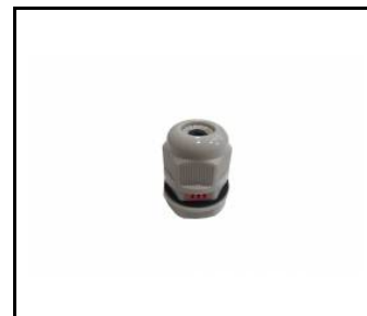
Dławnica odpowietrzająca różna szara M20*1.5 IP68 (16000507)