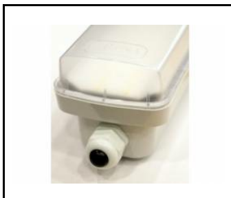
Ząslepka dławnicy M16 różna PA czarna M-16 - BPM-21 (60000006)