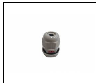
Dławnica odpowietrzająca różne szara M20*1.5 IP68 (16000507)