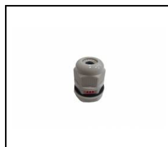
Divers presse-étoupe gris M20 * 1.5 IP68 (16000507)