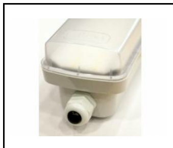
Bouchon presse-étoupe M16. divers PA noir M-16 - BPM-21 (60000006)

Date de création de la carte: 19 août 2024