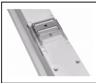
regulowane uchwyty / adjustable handles / einstellbare Halterungen