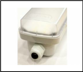
Bouchon presse-étoupe M16. divers PA noir M-16 - BPM-21 (60000006)

Date de création de la carte:24 mars 2025