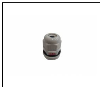
Divers presse-étoupe gris M20 * 1.5 IP68 (16000507)