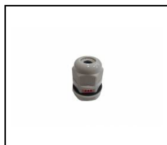
Divers presse-étoupe gris M20 * 1.5 IP68 (16000507)