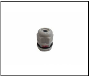
Drüse Entlüftung verschiedene grau M20*1.5 IP68 (16000507)