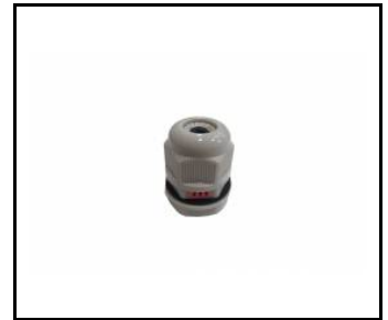
Drüse Entlüftung verschiedene grau M20*1.5 IP68 (16000507)