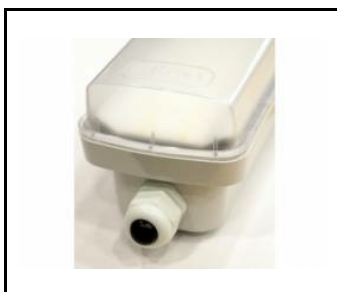
Blindstopfen für M16-Kabelverschraubung verschiedene PA schwarz M-16 – BPM-21 (60000006)

Erstellungsdatum der Karte: 24 März 2025