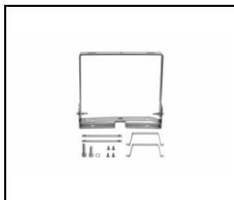
OCULUS LED - support universel- manque de compatibilité avec la version 294W de Dali (964886)